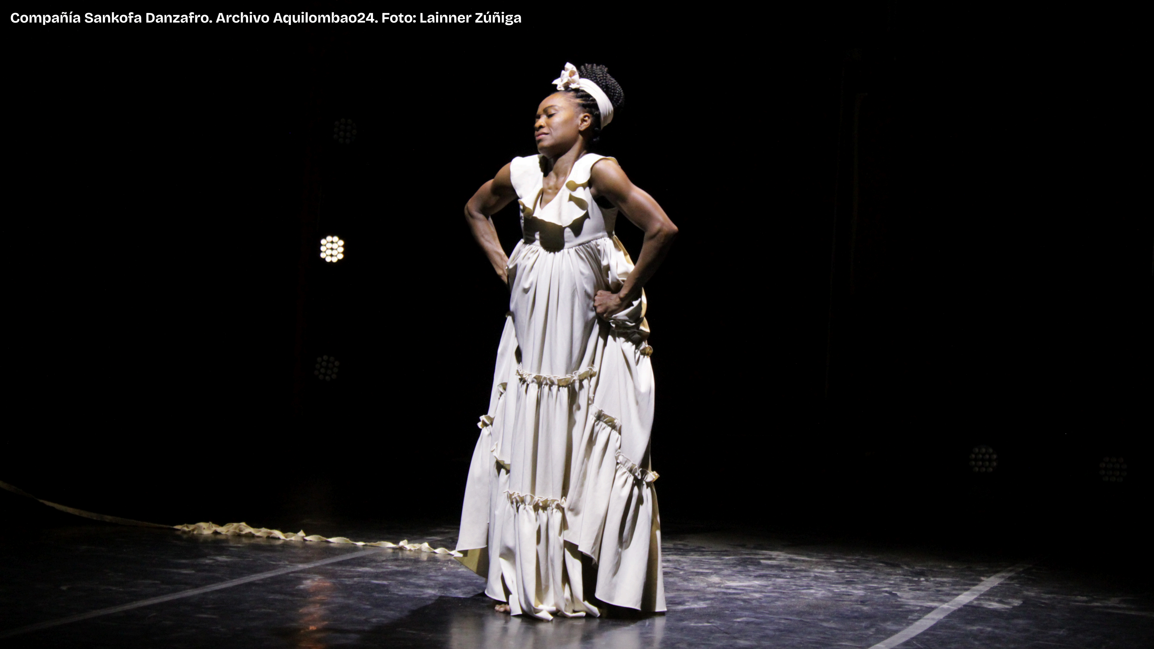
Compañía Sankofa Danzafró.