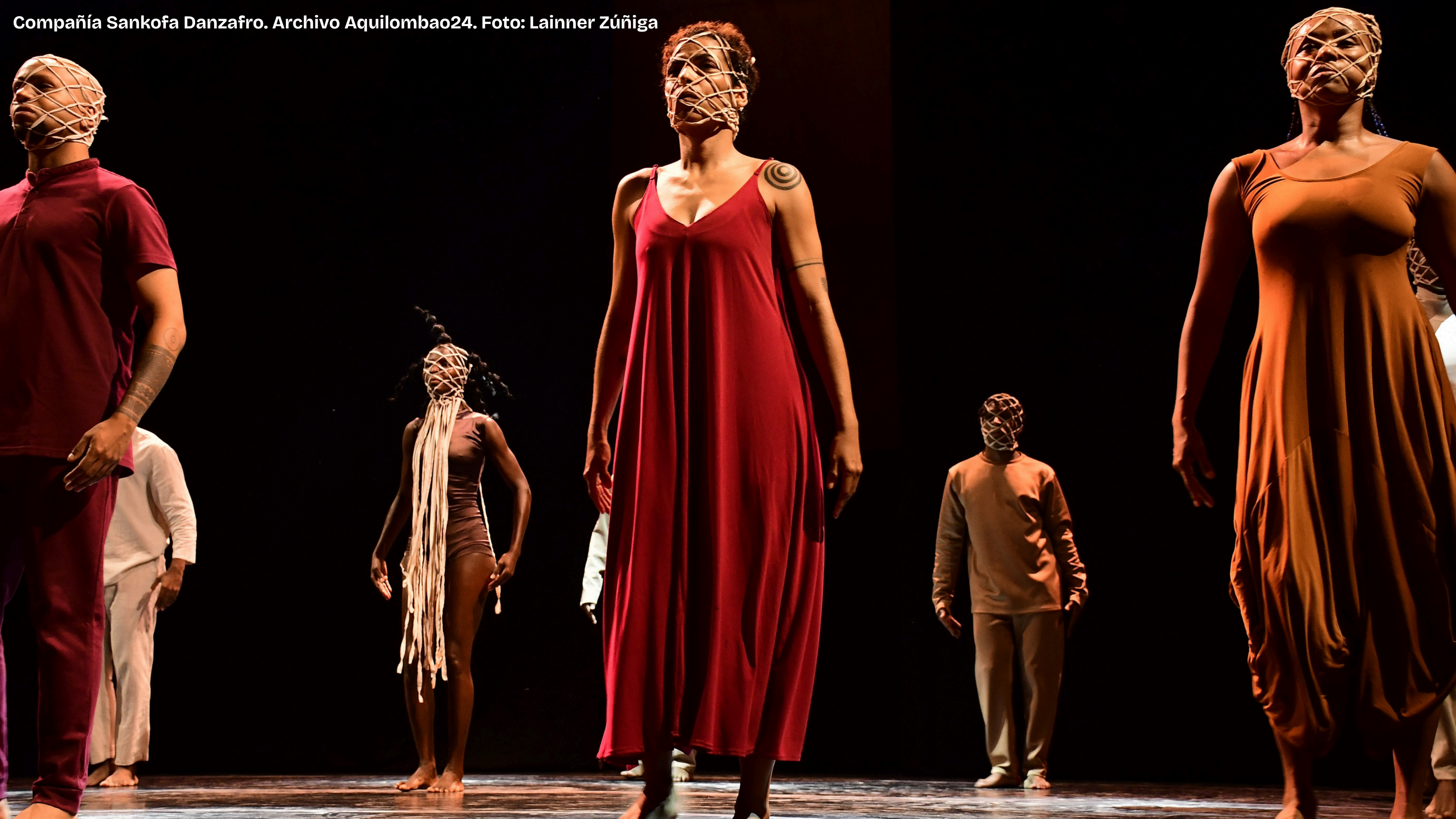
Compañía Sankofa Danzafró.